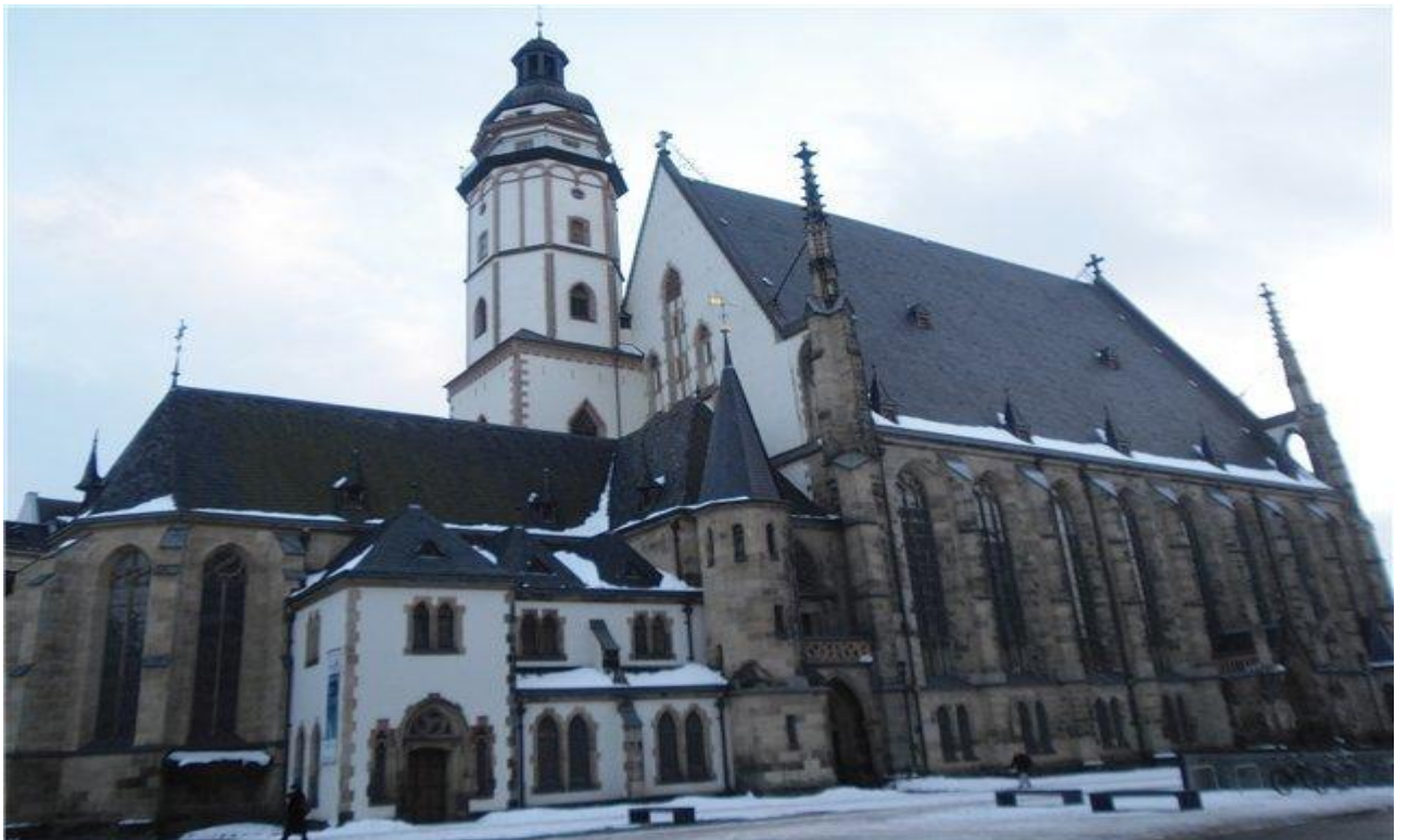
Церковь Святого Фомы в Лейпциге