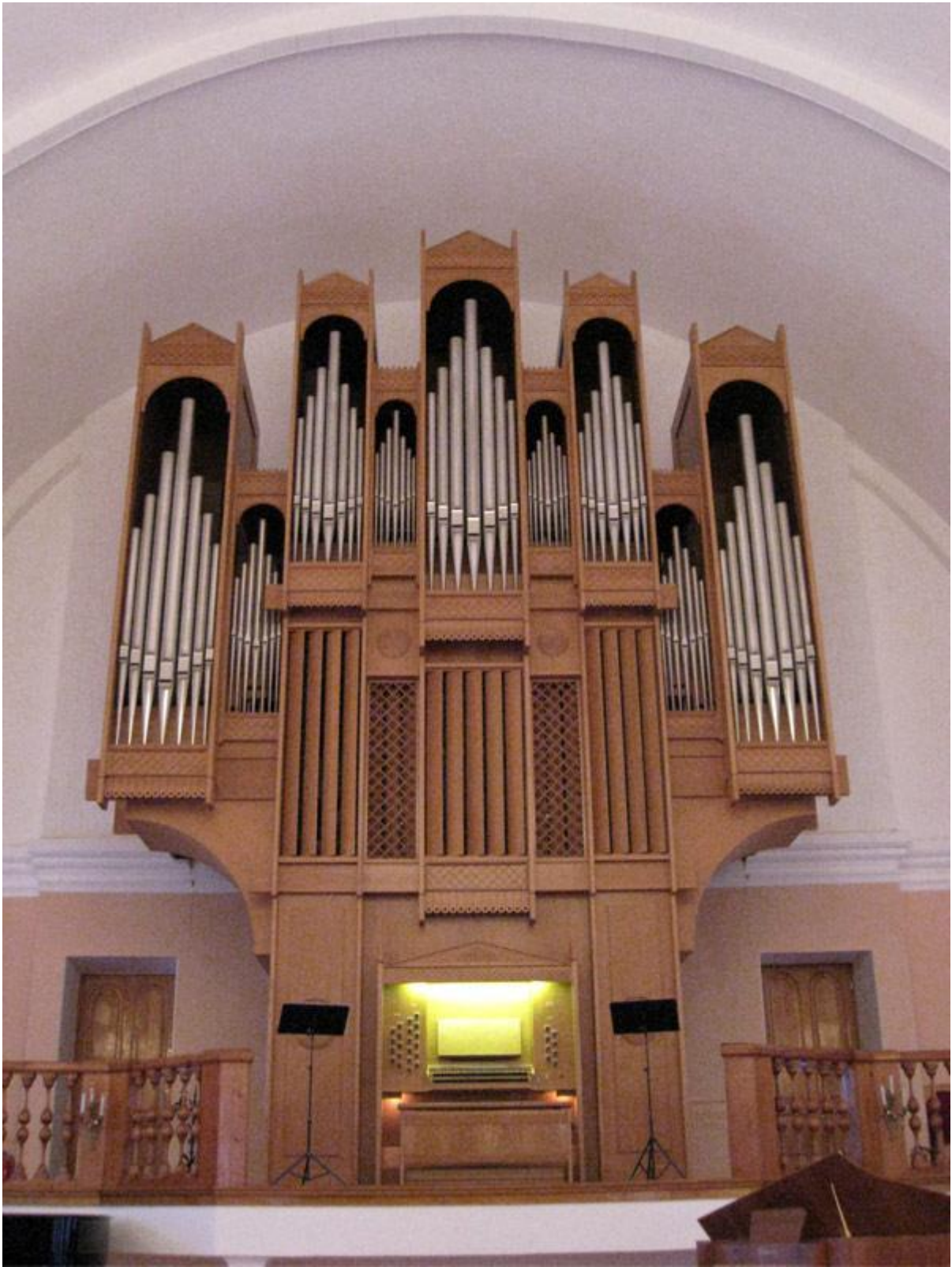
Орган – король музыкальных инструментов