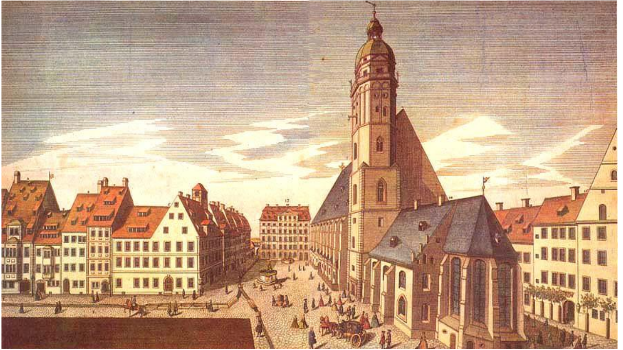
Лейпциг времён И. С. Баха